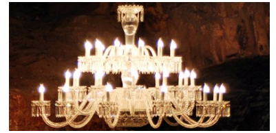
Cristal de Saint Louis