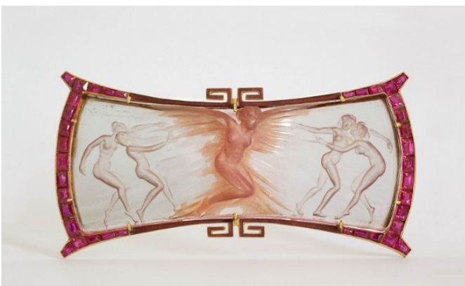
Un bijou Lalique