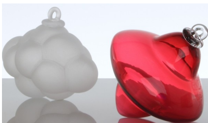
Les boules de Noël de Meisenthal