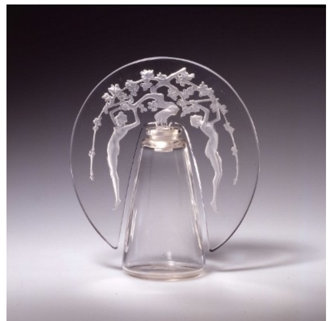
Un flacon de Parfum Lalique